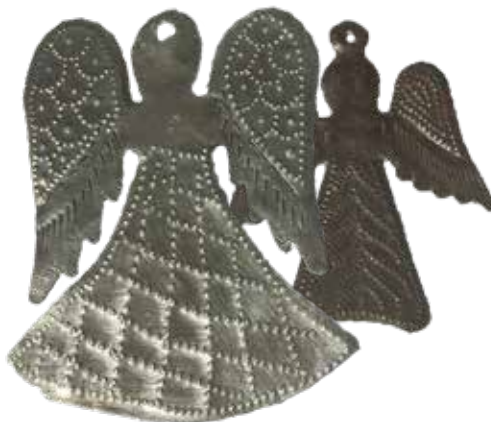
Angioletti in Fer Forgé

Per informazioni, prenotazioni, per definire altri eventuali dettagli della bomboniera chiama lo 02.54122917 oppure scrivi a ricorrenze@nph-italia.org