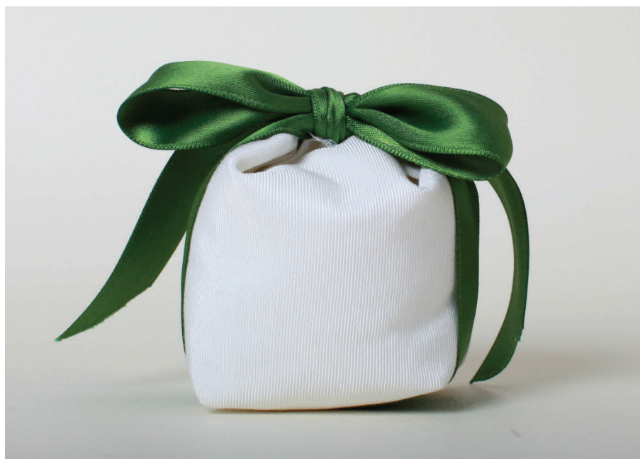
n° 22 con nastro verde scuro € 6*

*donazioni minime suggerite a copertura costi. A parte sarà la vostra donazione libera sul progetto che avrete scelto.