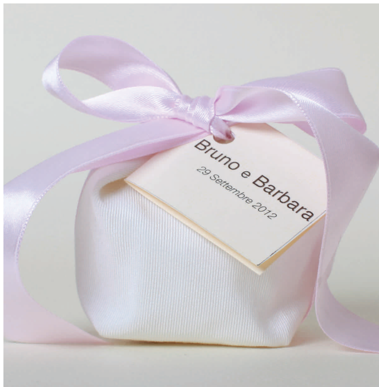
n° 19 con nastro rosa € 6*