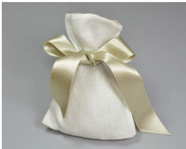
n° 3 € 5*