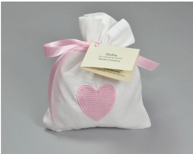
n° 9 € 5*