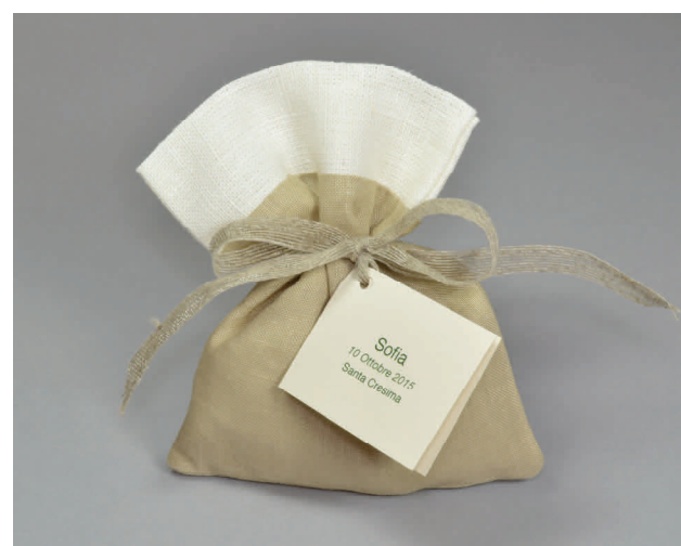
n° 6 € 5*

*donazioni minime suggerite a copertura costi. A parte sarà la vostra donazione libera sul progetto che avrete scelto.