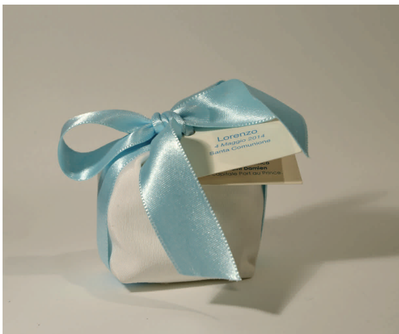
n° 20 con nastro azzurro € 6*

* donazioni minime suggerite a copertura costi. A parte sarà la vostra donazione libera sul progetto che avrete scelto.