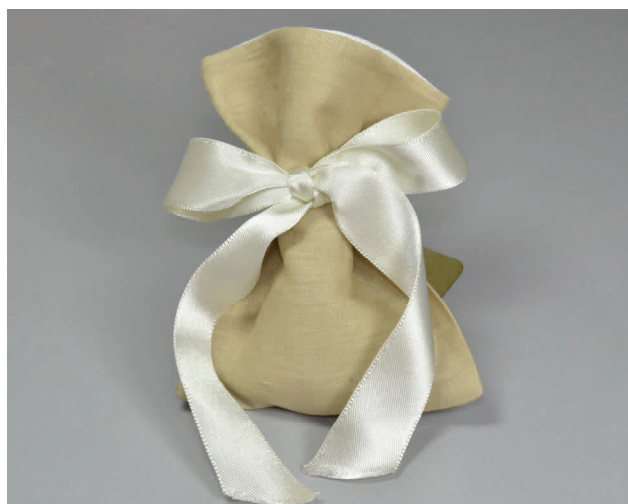
n° 4 € 5*