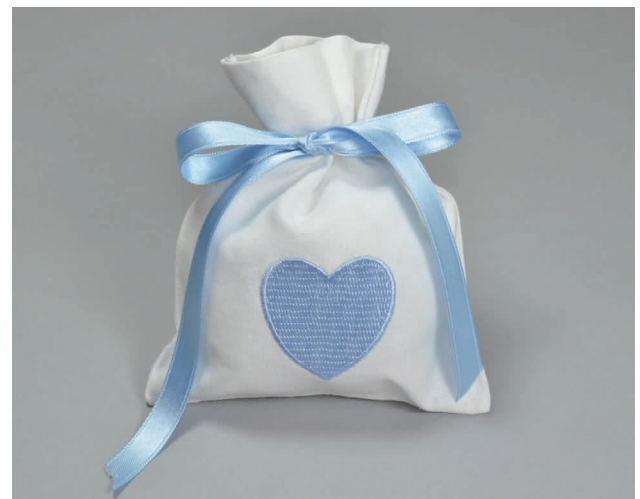
n° 10 € 5*

*donazioni minime suggerite a copertura costi. A parte sarà la vostra donazione libera sul progetto che avrete scelto.