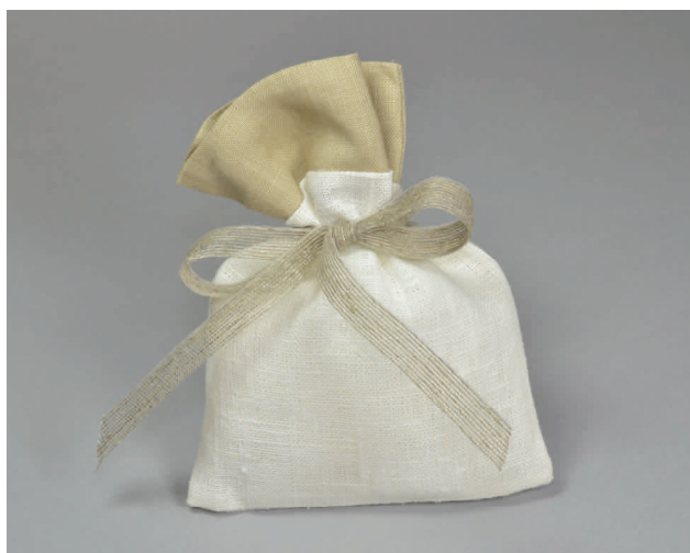
n° 5 € 5*