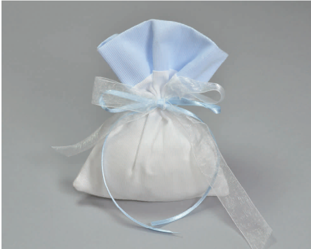
n° 7 € 5*