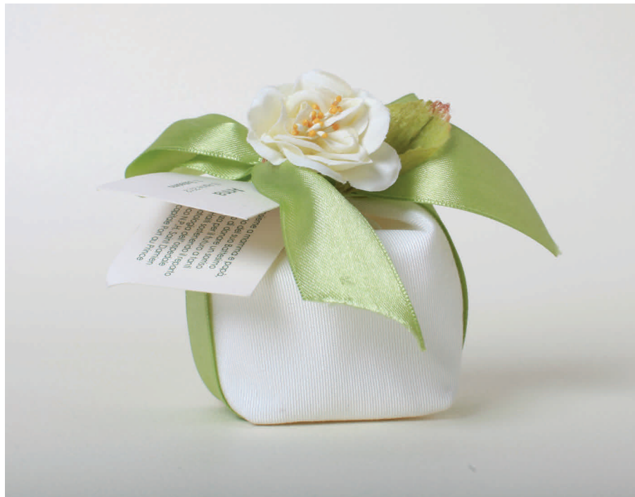
n°21 con nastro verde chiaro € 6* + € 0,50