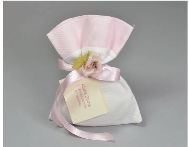
n° 8 € 5* + € 0,50