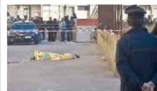
13/01/2012 Inferno a Trapani: stermina la famiglia e le dà fuoco