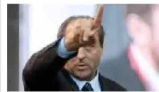
Referendum, la Consulta boccia i due quesiti