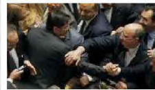
Cosentino, la Camera vota: no all'arresto