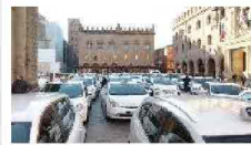
Commercio: sconti, saldi e svendite senza limiti