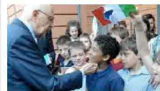
13/01/2012 "Il servizio civile? Va esteso anche agli immigrati"