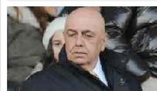
Il Milan oscura lo sport di Mediaset