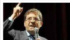
Ecco i capi d'imputazione contro Cosentino