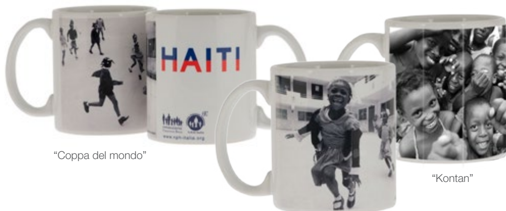
"Coppa del mondo"

Mug e Notes che riproducono foto d'autore scattate nella Casa N.P.H. di Haiti da Stefano Guindani, noto fotografo di moda, arte e celebrities, da tempo volontario e sostenitore della Fondazione Francesca Rava.