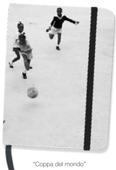
"Coppa del mondo"