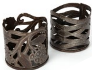
Porta bottiglia da tavola

I Fer Forgé sono opere d'arte haitiana, sculture di metallo ritagliato, battuto, inciso e dipinto a mano dagli artisti di strada che utilizzano come materia prima i bidoni di idrocarburi. Piccole sculture per arredare la casa e oggetti decorativi, da regalare con Haiti nel cuore.