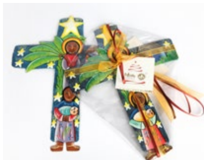
Croce dipinta a mano (20x24 cm ca.)