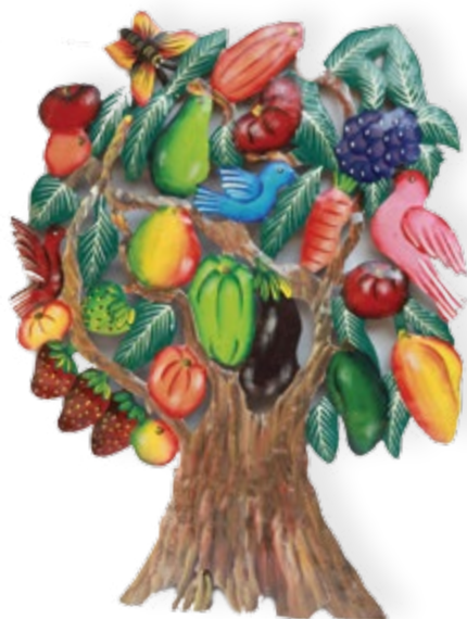
“Albero della vita” dipinto a mano (42x55 cm ca.)