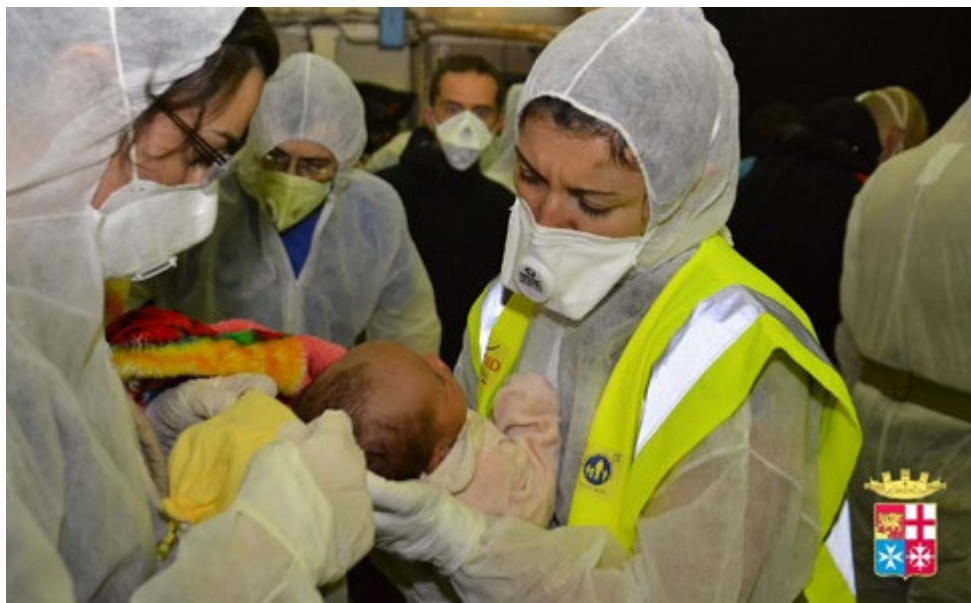
Un'ostetrica volontaria della Fondazione in azione nella missione Mare Nostrum. Le testimonianze su www.nph-italia.org .