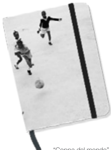
“Coppa del mondo”