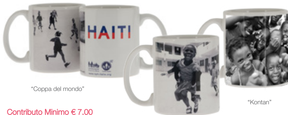
“Coppa del mondo”

Mug e Notes che riproducono foto d'autore scattate nella Casa N.P.H. di Haiti da Stefano Guindani, noto fotografo di moda, arte e celebrities, da tempo volontario e sostenitore della Fondazione Francesca Rava.