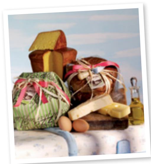
Pizza al formaggio Muzzi 500 gr. Contributo minimo € 9,00

Dalla grande tradizione culinaria umbra, proponiamo le due specialità dolce e salata che non possono mai mancare su una tavola di Pasqua.