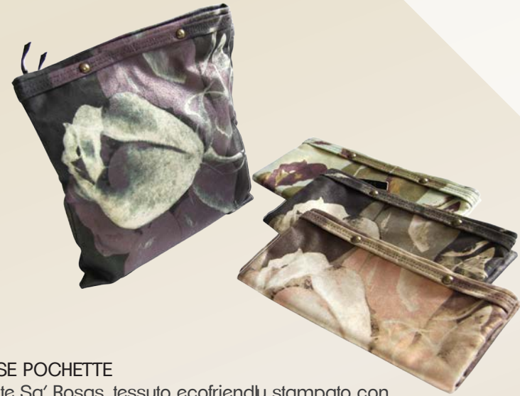
LA ROSE POCLETTE Pochette Sa' Rosas, tessuto ecofriendly stampato con lamina dorata/argentata. La rosa, simbolo di bellezza, in 4 versioni di colore per un regalo di personalità.