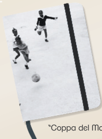
"Coppa del Mondo"