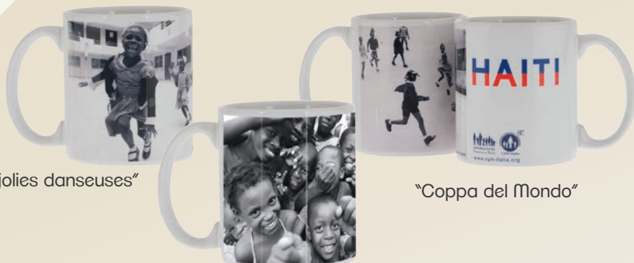
"Les jolies danseuses"

Mug e Notes con foto d'autore scattate nella Casa N.P.H. di Haiti da Stefano Guindani, noto fotografo del mondo della moda, arte e celebrities, da tempo volontario e sostenitore della Fondazione Francesca Rava.