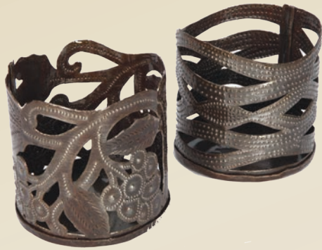
PORTA BOTTIGLIA da tavola Donazione minima € 10