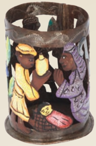
PORTA CANDELA NATIVITÀ Donazione minima € 10