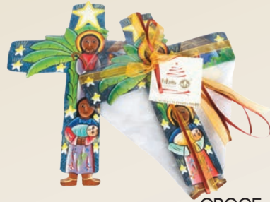
CROCE dipinta a mano 20X24 cm ca. Donazione minima € 10