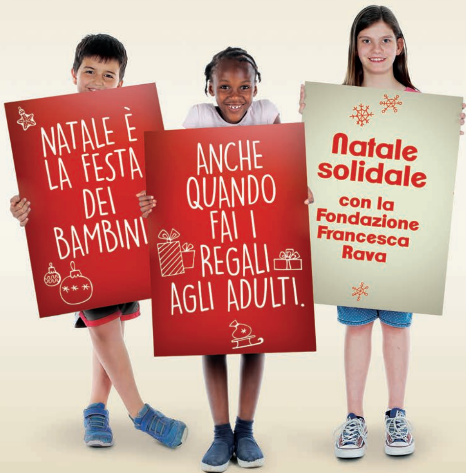
i bambini ritratti sono legati alla Fondazione

Scegliendo i nostri doni di Natale aiuterai migliaia di bambini in grave difficoltà in Italia, in Haiti e nelle Case orfanotrofo N.P.H. in America latina