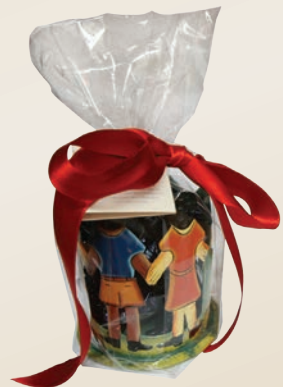
PORTA MATITE BAMBINI Donazione minima € 10