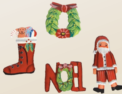
DECORAZIONI NATALIZIE Stivale, Babbo Natale, Noel e corona Donazione minima € 3 cad.