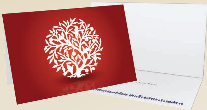
COD. D2 Disegno originale haitiano "Albero della vita"

17x11 cm, cartoncino doppio completo di busta, stampa su carta monopatinata bianca.