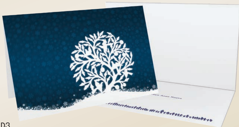
COD. D3 Disegno originale haitiano "Albero della vita"

11x17 cm, cartoncino doppio completo di busta, stampa su carta monopatinata bianca.