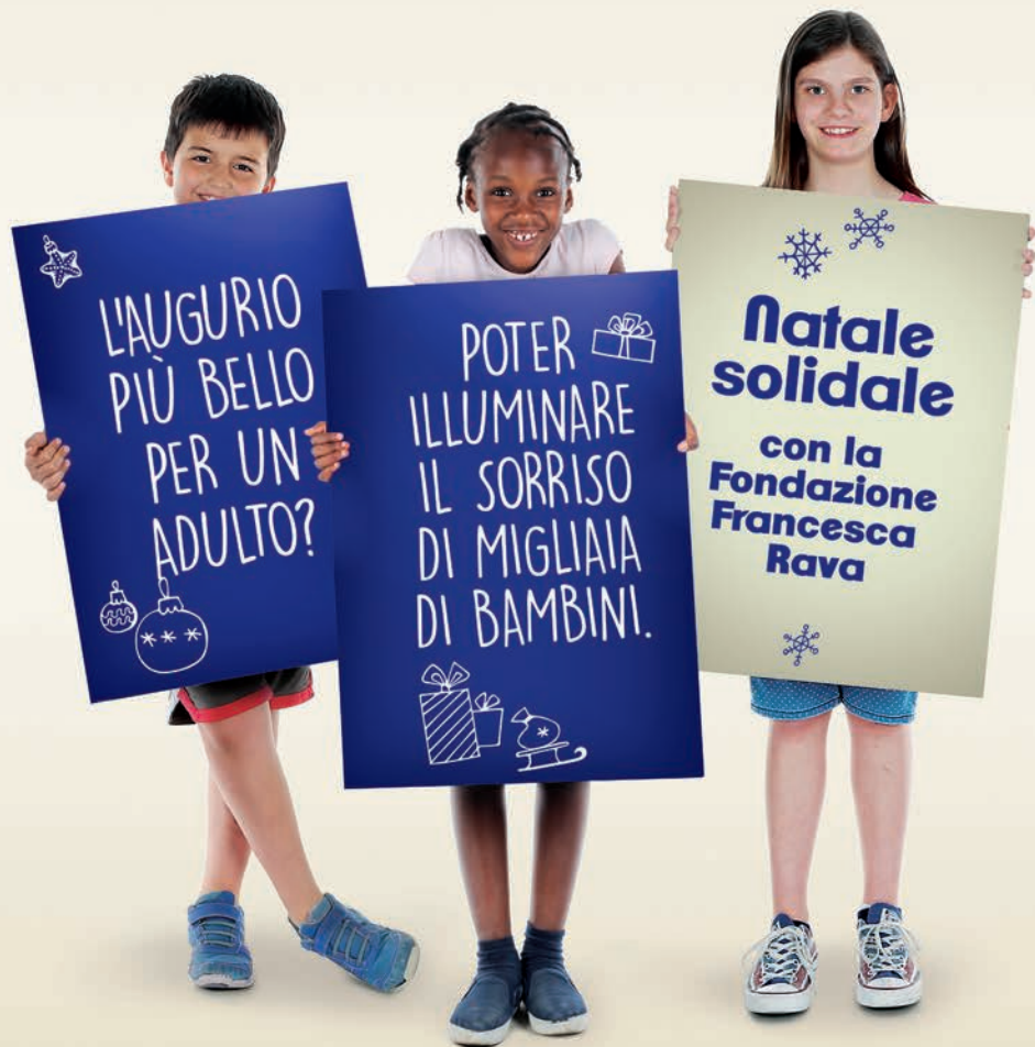
i bambini ritratti sono legati alla Fondazione

biglietti solidali per aziende e privati