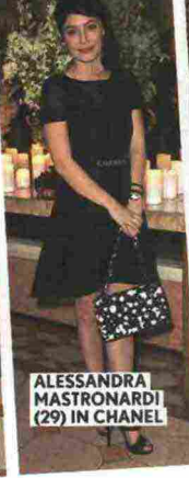
ALESSANDRA MASTRONARDI (29) IN CHANEL