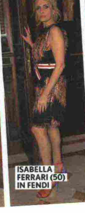
ISABELLA FERRARI (50) IN FENDI