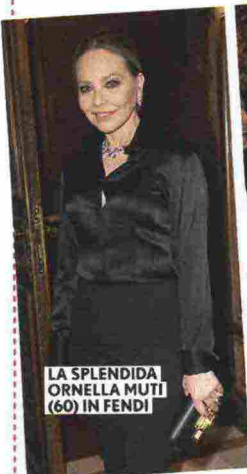
LA SPLENDIDA ORNELLA MUTI (60) IN FENDI