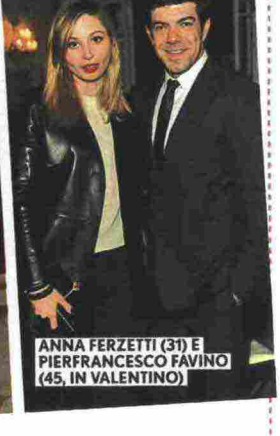
ANNA FERZETTI (31) E PIERFRANCESCO FAVINO (45, IN VALENTINO)